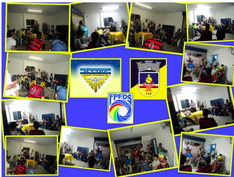
Reunião com diretores e atletas da ASSPE e ASO sobre Campeonato de Futsal da LINEDS