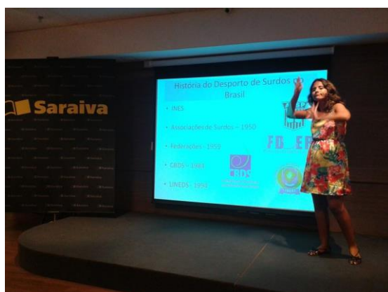
Participantes do Congresso Técnico do I Jogos Metropolitanos de Surdos (I JMS)