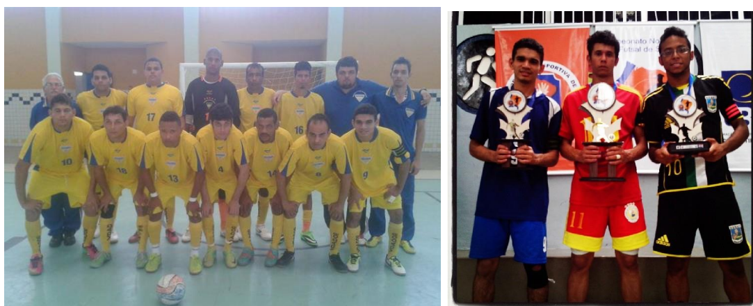
Equipe da ASSPE foi vice-campeã do Campeonato Nordestino de Futsal de Surdos (LINEDS)