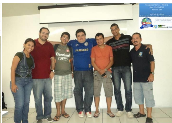
Créditos da Foto: FPEDS - Recife, 22/11/2013