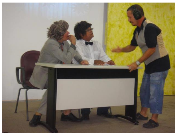
Evento cultural "Humor Surdo Show"