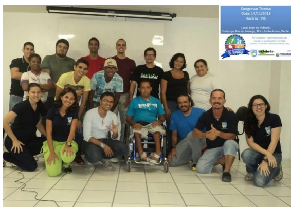
Recife, 14/11/2013