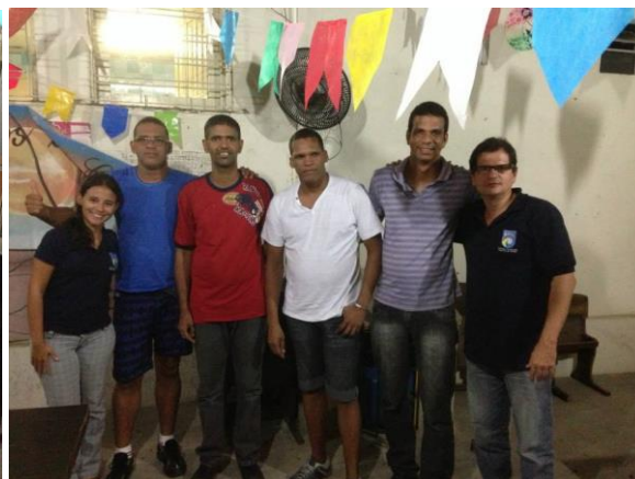
Reunião com ASO