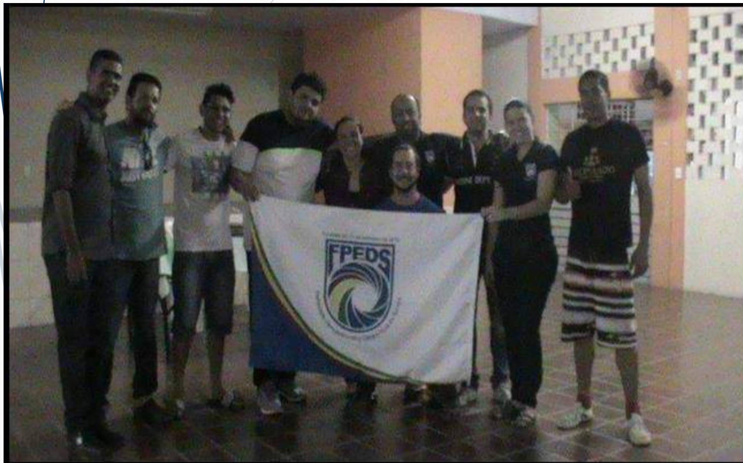
Assembleia Geral Ordinária da FPEDS