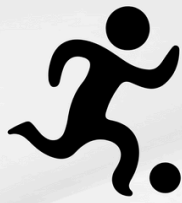
TABELA DE CARTÕES